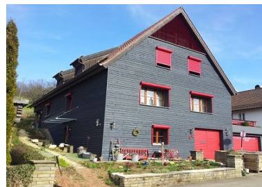
Vorderseite mit Garten