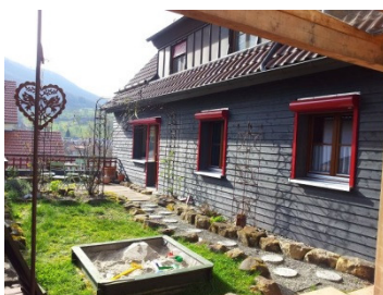
Seitenansicht mit Garten